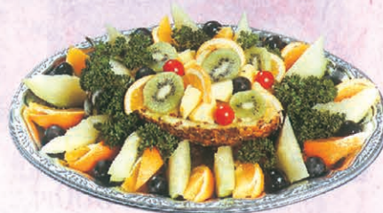
F-68 フルーツ盛合わせ 5,500円 (税別)