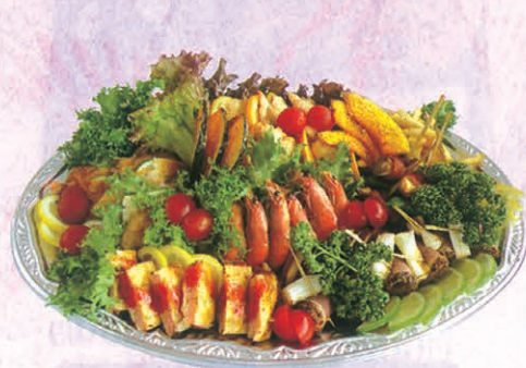
F-66 オーダブル 5,000円 (税別)