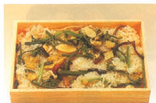
F-77 山菜おこわ 700円 (税別)