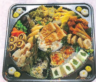
F-74 本精進オーダブル 5,500円 (税別)