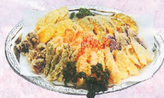
F-76 精進天ぷら 3,300円 (税別)