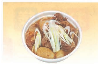
F-80 芋子汁 640円 (税別)

●単品で5個以上または3,000円以上をお願いします。 ●カタログでのご注文はお届け日の4日前までにお願い致します。