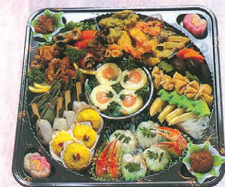
F-73 半精進オーダブル 6,500円 (税別)