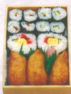
F-72 のり、いなり 750円 (税別)