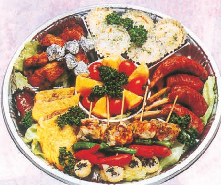
F-67 オーダブル 4,500円 (税別)