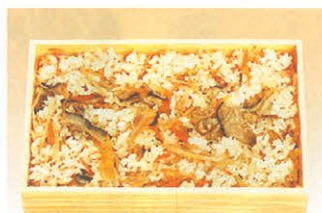
F-78 五目ごはん 450円 (税別)