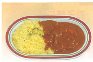
F-79 カレーライス 450円 (税別)