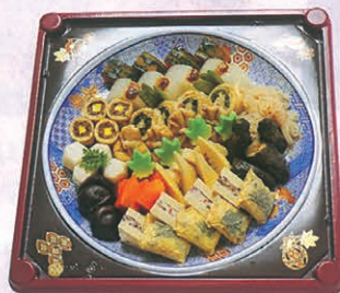
F-75 煮メ盛 3,800円 (税別)