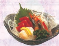
F-70 お刺身 1,000円 (税別) ~