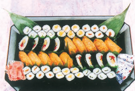
F-71 すし盛合わせ 4,200円 (税別)