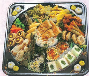
F-74 本精進オーダブル