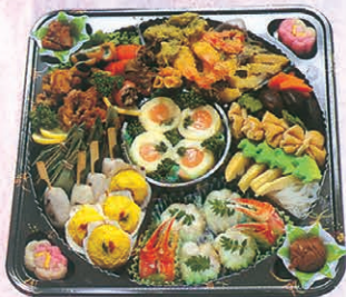
F-73 半精進オーダブル