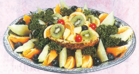
F-68 フルーツ盛合わせ