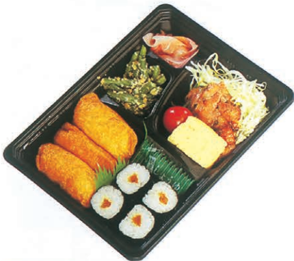
F-44 すし弁当 700円 (税別)