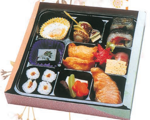
F-46 すし弁当 1,150円 (税別)