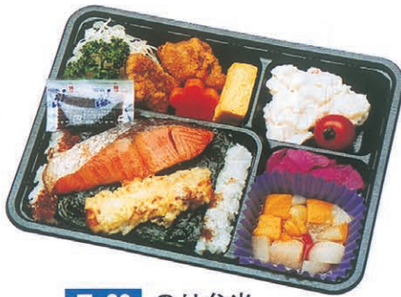
F-39 のり弁当 700円 (税別)