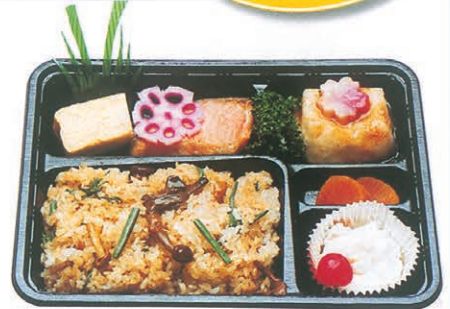
F-40 味つけごはん弁当 700円 (税別)