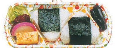
F-49 プチおにぎり弁当 420円 (税別)