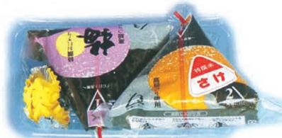
F-51 おにぎり2個入れ 290円 (税別)

●単品で5個以上または3,000円以上でお願いします。 ●カタログでのご注文はお届け日の4日前までお願い致します。