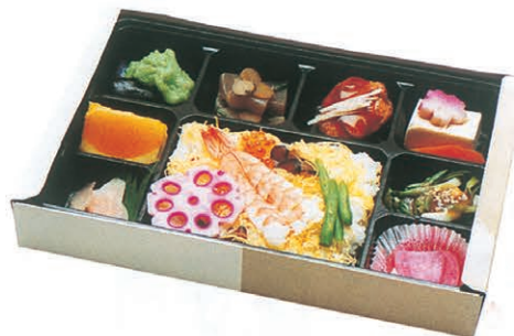
F-45 ちらし弁当 1,050円 (税別)