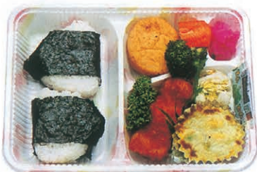
F-47 おにぎり弁当 550円 (税別)