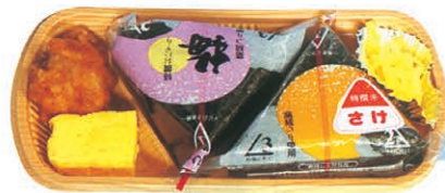
F-48 包みおにぎり弁当 450円 (税別)