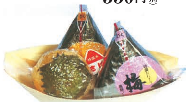
F-50 みそ焼おにぎり のりおにぎり 1個 160円 (税別) 1個 140円 (税別)