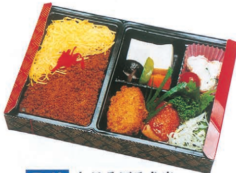
F-42 とりそぼろ弁当 800円 (税別)