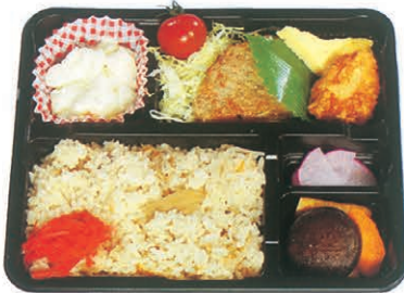
F-41 炊き込みごはん弁当 700円 (税別)