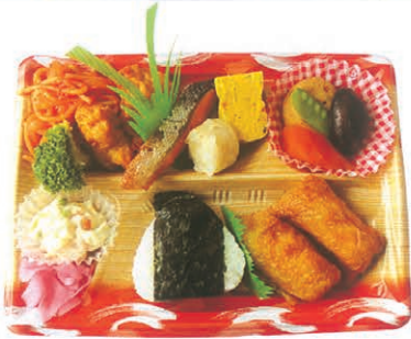
F-38 ピクニック弁当 ※いなり2個を おにぎりに変更可 650円 (税別)