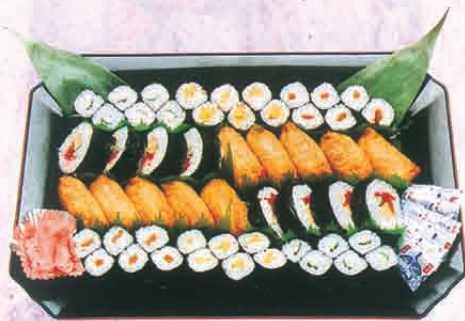
F-71 すし盛合わせ 3,240円