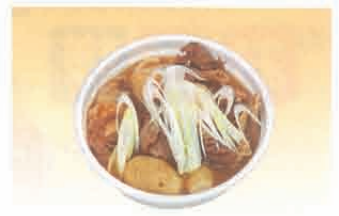
F-80 芋子汁 600円