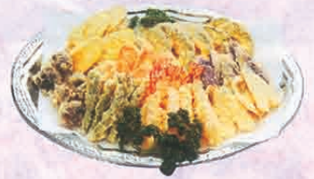
F-76 精進天ぷら 3,300円