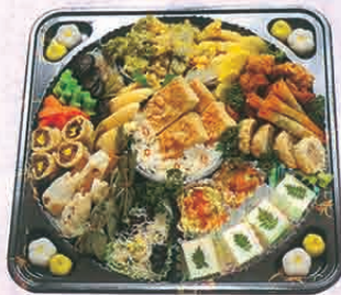
F-74 本精進オーダブル 5,500円