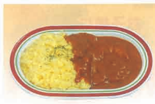
F-79 カレーライス 450円