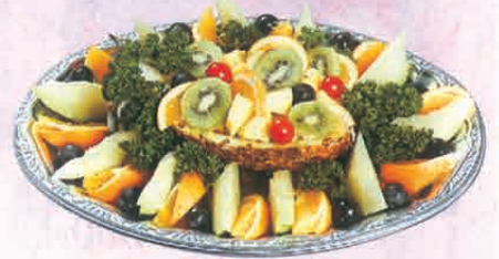
F-68 フルーツ盛合わせ 3,300円