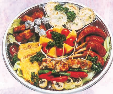
F-67 オーダブル 4,500円