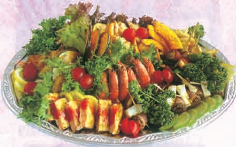
F-66 オーダブル 5,000円