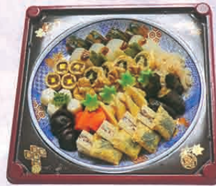
F-75 煮メ盛 3,600円