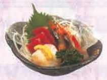
F-70 お刺身 830円~