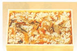
F-78 五目ごはん 300円