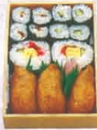
F-72 のり、いなり 500円