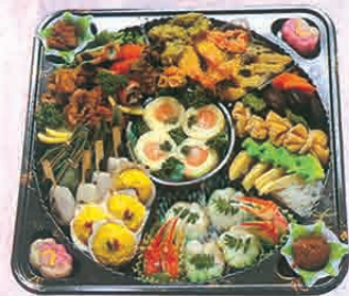
F-73 半精進オーダブル 6,500円