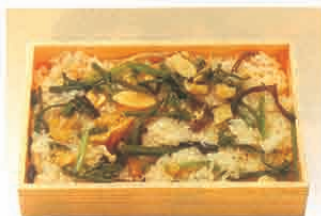
F-77 山菜おこわ 500円