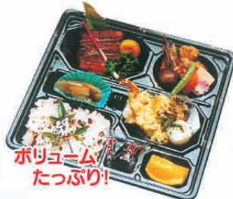
F-05 祝御料理詰梅 2,500円