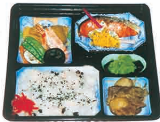
F-04 お祝い弁当 1,500円