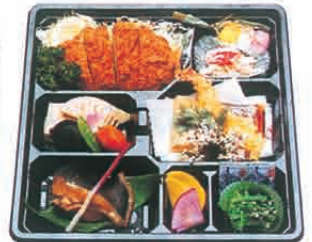
F-07 建前・祝御料理詰松 2,600円