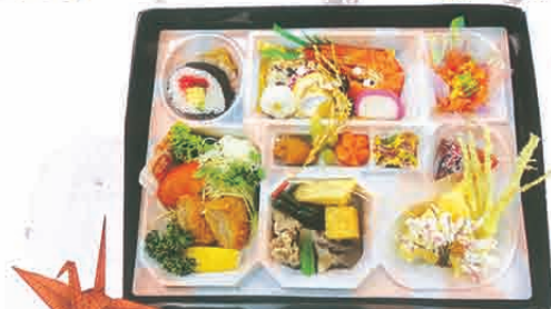
F-14 集い料理 2,600円