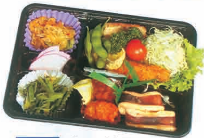
F-10 集い料理 650円