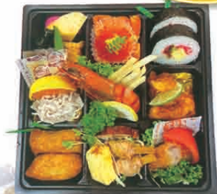
F-12 集い料理 1,250円