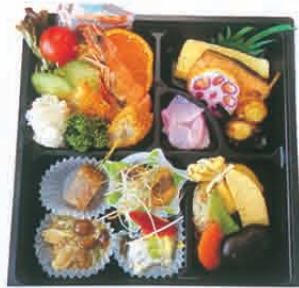
F-11 集い料理 1,050円