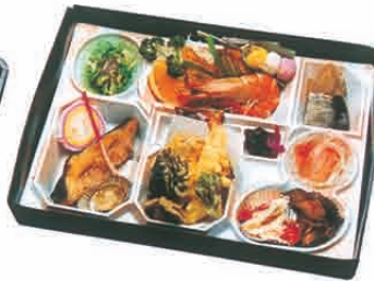
F-06 建前・祝御料理詰竹 2,400円