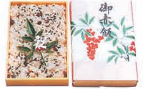
F-08 赤飯 470円 赤飯一升 2,600円