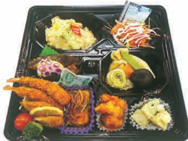
F-13 集い料理 1,600円