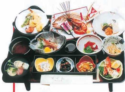
F-01 祝膳 6,800円